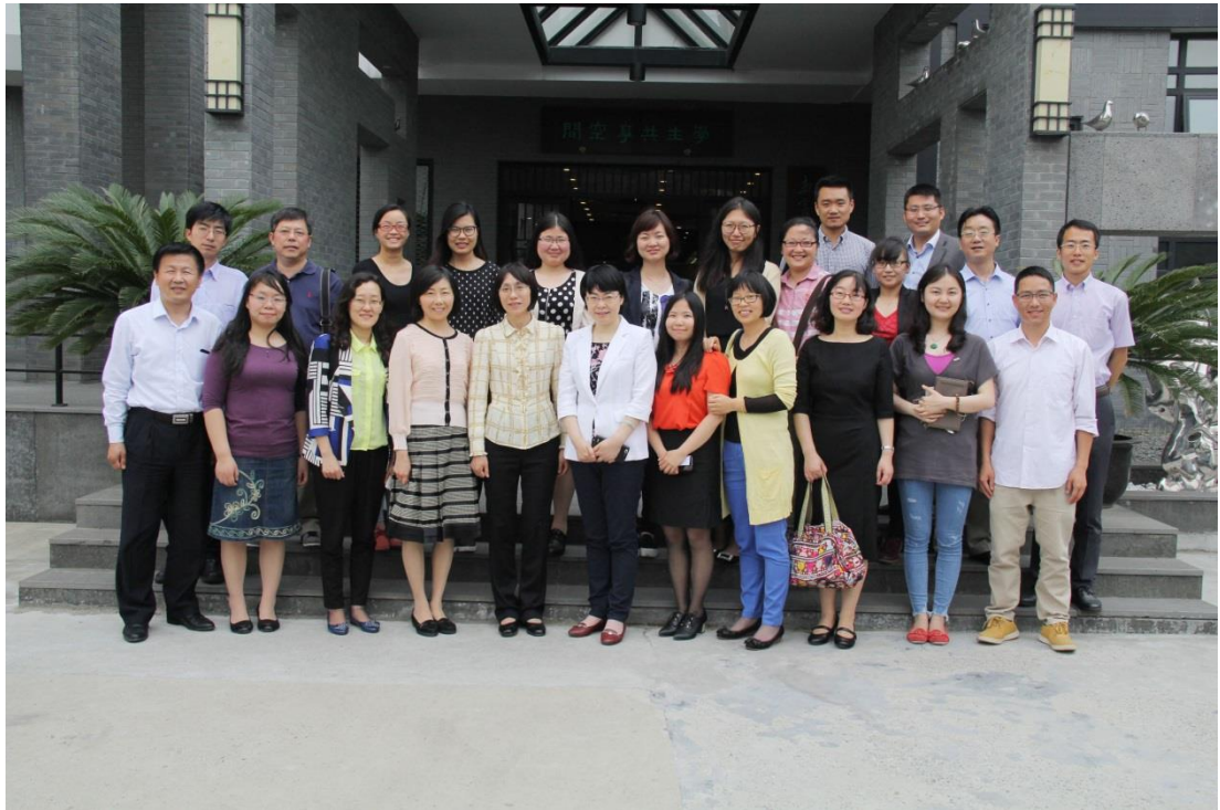
参加“牵手”共建活动的党员们

此次活动是三个支部首次开展联合支部“牵手行动”，通过此次活动促进了学校机关部门与院系、书院之间的相互了解、相互协作，并为今后进一步合作奠定了良好的基础。