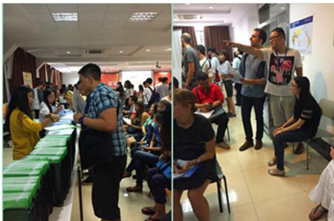
党员们细心服务引导留学生

迎新当日，党员们及早到达布置场地，树引导标语、布置桌椅。从校门口引导到物理楼大厅咨询，再到大厅内注册主会场，每个岗位上都活跃着党员们的身影。在留学生报到的高峰期，师生党员们稳妥应对，有序引导，以热忱的微笑、真诚的服务、巧妙的沟通化解语言障碍，赢得了留学生们的认可，展现了师大“新家庭”的温暖。在双方支部党员们共同努力下，迎新活动圆满结束。本次迎新活动以支部牵手共建的形式开展，增进了支部间凝聚力，以志愿服务的形式展现了党员风采，深化了服务型党组织建设。