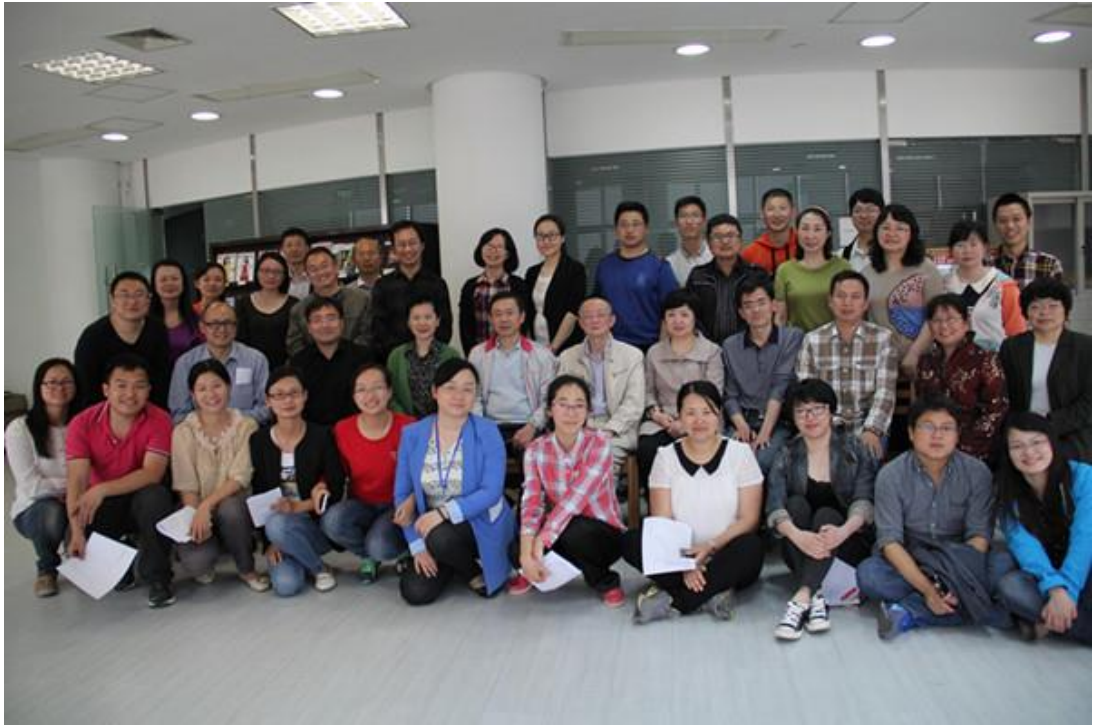
参与活动的党员们

活动中欢声笑语不断，气氛非常热烈。本次支部“牵手”活动拉近了哲学系和职能部门的距离，让党员们加深了了解，促进了大家的交流与沟通。接下来，人事处党支部和哲学系教工党支部将围绕师资培养、人才引进、职业发展、相关政策解读等方面开展了丰富多彩的组织生活。