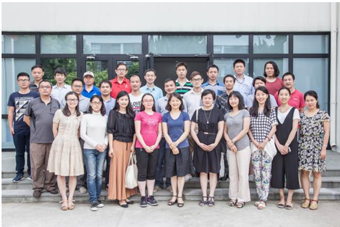
参与共建活动的支部党员们

院教工支部和保卫处（武装部）党支部在交流中增进了相互理解，为后期深化合作铺垫了基础。