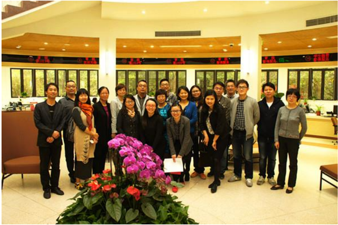
参与牵手共建活动的党员们